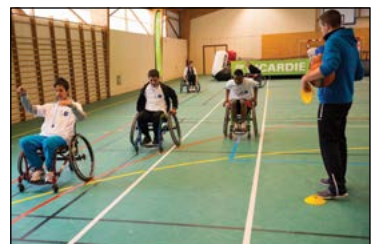
© Xavier Renoux / Région Picardie